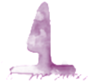
José Hutjes Keramiek

Aanvulling en uitwerking Protocol verantwoord naar een les/cursus/training (sector cultuureducatie) voor muziekscholen, centra voor de kunsten en volksuniversiteiten, zowel voor individuele als groepslessen